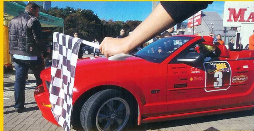
To nie rajd, ani wyścig, ale jest rywalizacja i wyłonieni są zwycięzcy