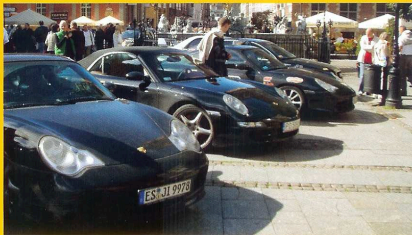
Klasyczna 911 i stymulacja TIGER Energy Drink to wybuchowa mieszanka, która może wiele namieszać w końcowej klasyfikacji Rage-Race 2008

Martini Polska, jeden z głównych sponsorów Rage-Race 2008 zaprezentował swój team, który będzie bronił charakterystycznych barw od lat kojarzonych z imprezami motoryzacyjnymi na najwyższym poziomie