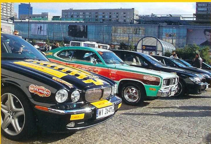
Zeszłoroczna pilotażowa impreza zgromadziła na starcie 50 pojazdów, w tym auta typu Jaguar, Lamborghini, Porsche, czy Corvette