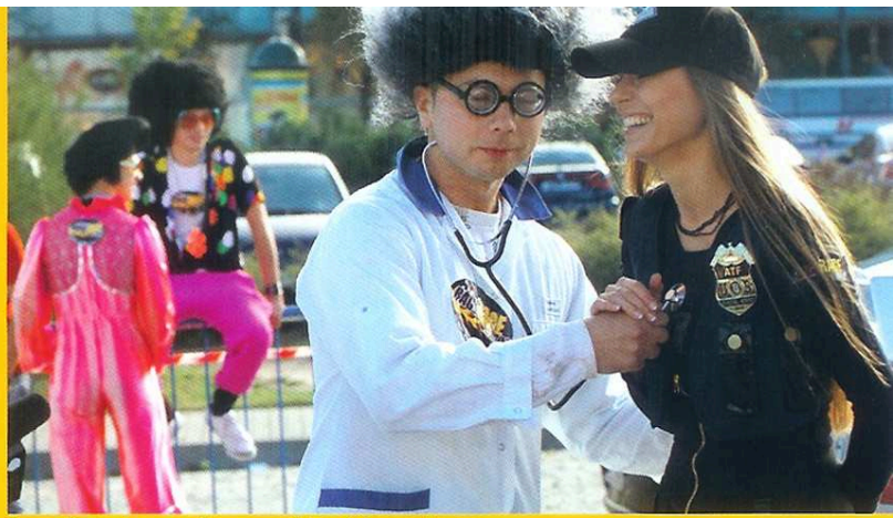
Rage-Race to przede wszystkim dobra zabawa

siadanie Astona Martina, Bentleya, Lamborghini, Ferrari bądź Hummera oraz zasobnego konta bankowego. Organizatorzy poprzez selekcję uczestników mają na uwadze zbudowanie niezapomnianego klimatu imprezy. Prawdopodobieństwo startu na pewno zwiększy rekomendacja któregoś z zeszłorocznych Rage-Racerów, ale ilość załóg ograniczona jest do 70. Dla VIPów odbędzie się internetowa charytatywna licytacja numeru startowego „00”. Jednak szansę na udział w tej zakręconej imprezie ma każdy. Na stronie www.rage-race.pl ruszyły zapisy i głosowanie, w którym internauci wybiorą „swoj” team,